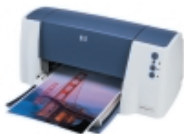
hp deskjet 3820

** Technologia oparta na rozwiązaniach zastosowanych w wielokrotnie nagradzanych drukarkach HP, m.in. w wybranych drukarkach serii HP Deskjet 900.